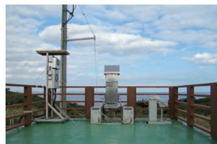
写真3 沖縄県辺戸岬における重金属類のモニタリング