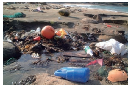
写真2 海岸に漂着したゴミ

2005年には「漂流・漂着ゴミに係る国際的削減方策調査業務」を受注し、2006年からは「有害金属対策戦略策定のための基礎調査業務」を受注したほか、有害有機汚染物質(POPs)、越境汚染の問題にも幅広く対応しています。