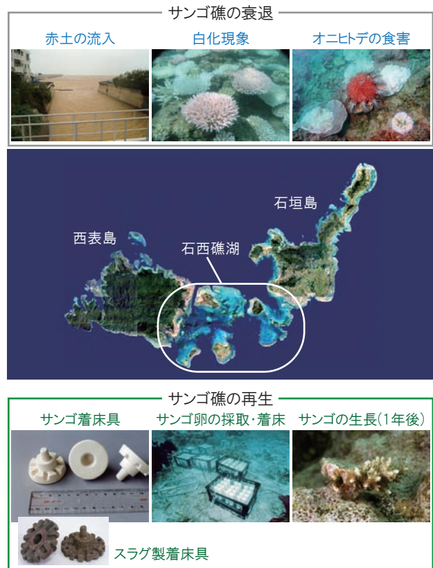
図3 着床具によるサンゴ移植技術の開発