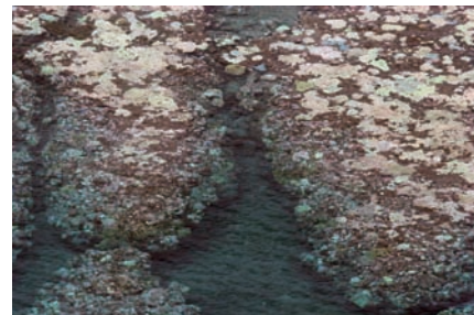
写真1 石西礁湖のサンゴ白化現象の例 (白っぽく見えるのが白化した部分)

2006、2007年には国際的枠組みのなかで、船舶からの大気汚染物質の排出削減のための「船舶版アイドリングストップ」の仕組みの開発に取り組みました。