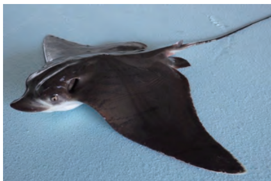
写真1 ナルトビエイ

有明海はアサリやタイラギなど二枚貝類の好漁場として広く知られてきましたが、その漁獲量は、1980年代から急激に減少しています。その原因として、貧酸素水塊や底質の悪化などさまざまな環境要因が挙げられてきましたが、二枚貝類を好んで食べることで知られる魚類「ナルトビエイ」が2000年頃から有明海で増加し始めたこともその一因ではないかと考えられています 7) (写真1)。