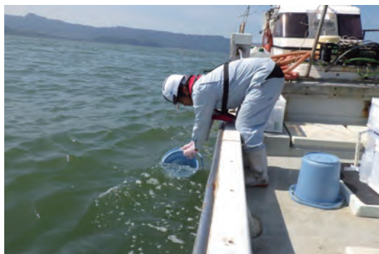
写真2 環境DNA分析サンプルの採水作業(有明海)

有明海におけるナルトビエイは、毎年4月頃から個体数が増加し始め、夏季には湾内を回遊しながら摂餌や繁殖活動を行い、海水温が低下する11月以降には湾外へ移動することが知られています 7) 。本種は、水産庁から「漁業有害生物」に指定されており、漁業被害対策として年間数十～数百トン程度が駆除されています。その一方で、環境省版海洋生物レッドリスト(2017)においては、準絶滅危惧にランクされており、その評価については来遊量や行動生態等の生物学的な基本情報をさらに集めたいうえで、慎重に考慮する必要があります。そこで今回は、ナルトビエイの来遊量(生物量)を把握するための調査手法として、環境DNA分析技術が有効かを検討する調査を行いました(写真2)。