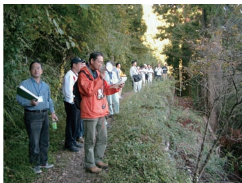
写真4 市民参加による地域資源の発掘

当社は、既存ストック(地域資源・人材・みち)の利活用に着眼し、「地域住民」が「地域資源」に愛着と誇りを持ち、「来訪者」は「地域資源」を通じて「地域住民」と触れ合うことができる魅力と活力あふれるまちづくりに取り組んでまいります。