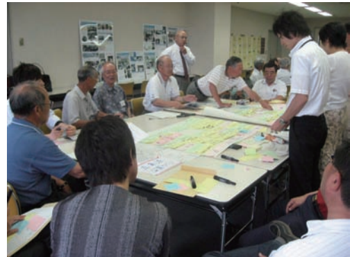
写真1 みんなで知恵を出しあって新しい町が作られていく

気がします。しかし、川で遊んだことのある人にとっては、川はもっと違った場所でした。そういった思い出を持った人たちが大勢集まって“秋田かわまちづくり”が生まれました。川の持つさまざまなおもしろさを再発見し、これを新しい地域づくりに役立てるといった発想は、どこか「温故知新」という教えにも似ているような気がしています。