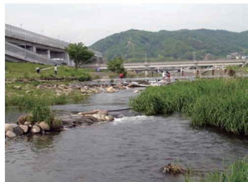
写真2 川で遊ぶ子供たち

このような技術を総動員してそれぞれの川が持っている特徴を明らかにし、その特徴を活かしたまちづくりをサポートしていくことが当社の使命であると考えています。たとえば、河川防災に配慮したかわまちづくり、河川景観を活かしたかわまちづくり、かわあそびや観光、スポーツなど、人々の利活用を考えたかわまちづくりなど、当社の技術を活かせるかわまちづくりは多岐にわたってあります。