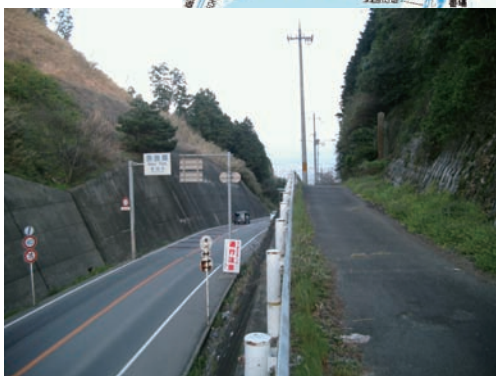
写真3 街道から地域の歴史・文化を読み解く