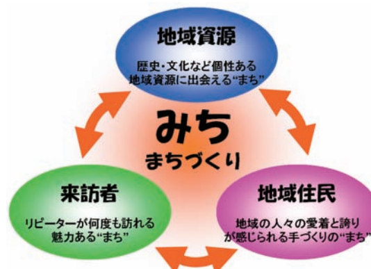
図2 既存ストックの利活用による“みちまちづくり”