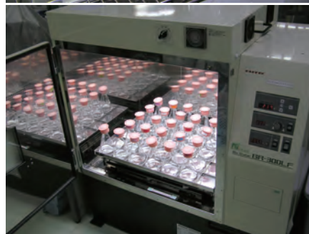
藻類(ムレミカツキモ)への毒性試験