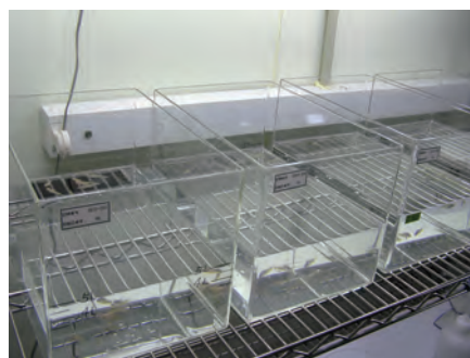
魚類(ヒメダカ)への毒性試験