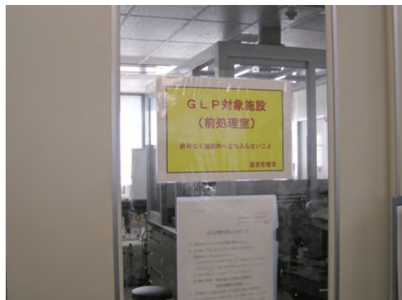
写真2 当社GLP対応施設

当社では、これら水生生物への影響を試験できるGLP(Good Laboratory Practice)の認証を取得しており、医薬品が生物に与える影響についての検討が可能です。