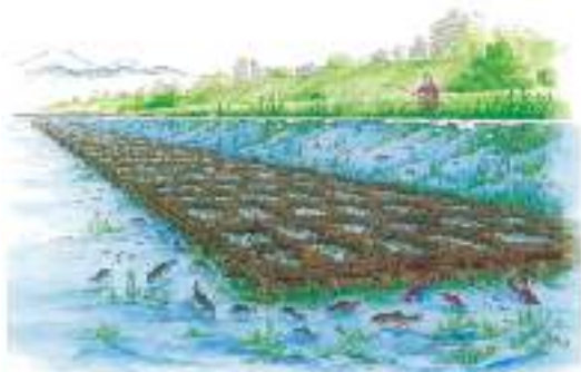
図1 粗朶沈床の構造と沈設後の水中イメージ※

粗朶沈床(図1)は、広葉樹の枝を束ねて格子状に組み、石を投じて水面下に沈め、河床の根固めなどに利用するものです。全体の構造が柔軟性に富むことから、沈設後の河床変動にも追従し、河床を常に覆い固めることが可能です。また、自然の素材を用いるため、長期的にみても環境を汚染する心配がありません。さらに、その多孔性により、魚などの水生生物の生息環境の創造が期待される工法です。