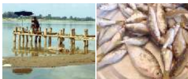
写真4 杭出し水制工の上で釣りをする地元住民(左)と粗朶沈床内に生息している魚(右)

ラオスにおける日本の河川伝統工法は、河岸侵食を防止するだけでなく、河川環境の再生にも貢献しているといえます。