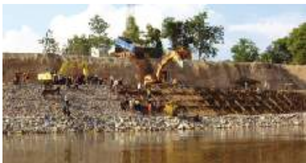
写真1 パイロット護岸工事での栗石柳枝工の適用

開発調査では、日本の河川伝統工法について、実際に「パイロット護岸工事」として施工することで、この工法の技術移転を行いました。この工事では、3箇所のサイトで粗朶沈床工に栗石柳枝工、杭出し水制工 くいだ すいせいこう を組み合わせ実施しました(図2、写真1・2・4)。