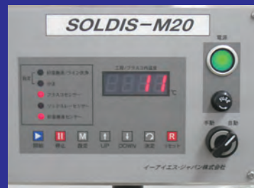
▲コントローラ操作パネル