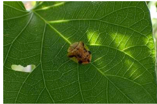
図1 ヨツモンカメノコハムシ。

以下に, 兵庫県における本種の採集データを記す。昆陽池では個体数が多くすべてを採集できなかったため, 標本として保管しているものについて記録する。