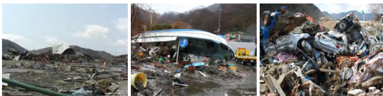
津波による漂流物の発生事例

発災時における安全確保や港湾施設機能の維持・早期復旧のため、漂流物の移動状況を把握し対策を行うことが求められています。