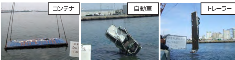
東日本大震災地震津波による漂流物の撤去作業(仙台塩釜港)