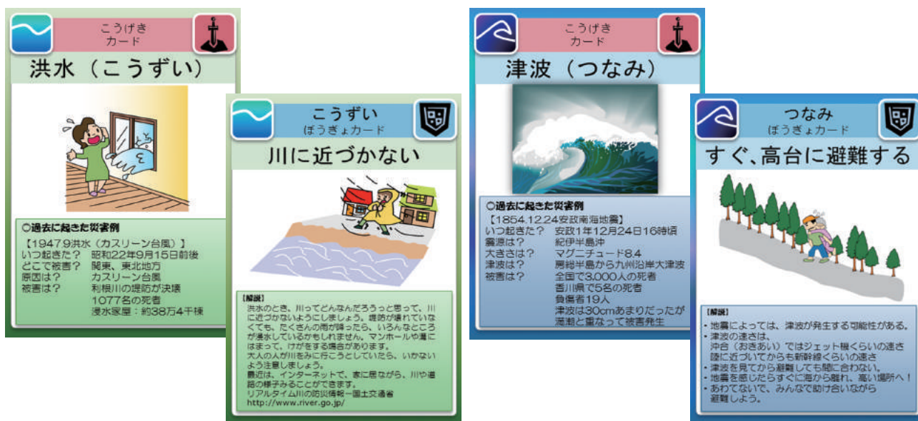
図 カードのサンプル(洪水・津波)