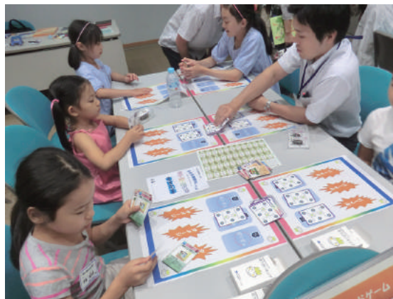
写真「ぼうさいキング」で学ぶ子どもたち

当社では、今までにない新しい防災・減災教育教材として「ぼうさいキング」を開発しました。「ぼうさいキング」は、対戦型のカードゲームで、楽しみながら、災害に対する行動や知識・知恵を学ぶことができるようになっています。右写真に示すように、いまままでに、たくさん子どもたちに、さまざまな場で楽しみながら防災・減災について学んでもらっています。