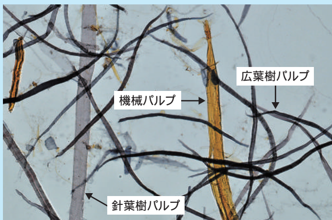
染色法による光学顕微鏡分析

当社では、紙パルプの検鏡、分析には、経験豊富な技術者が対応いたします。古紙パルプ配合率の分析は、当社の技術をご利用ください。