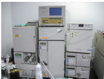
高速液体クロマトグラフィ

熟練の測定技術者により、高速液体クロマトグラフィー(HPLC)やプラズマ発光質量分析計(ICP-MS)を用いて測定し、再生PET配合品を検証します。