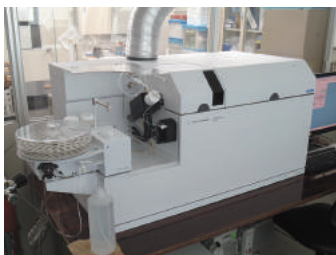
プラズマ発光質量分析計