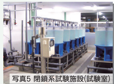
写真5 閉鎖系試験施設(試験室)