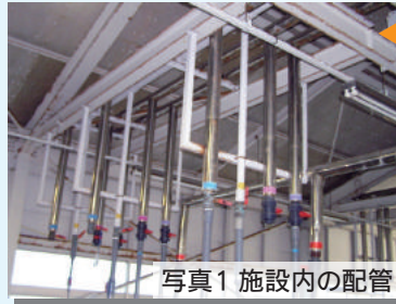
写真1 施設内の配管

施設内の配管(飼育水、ブローア等)は全て頭上に配置し(写真1)、パンライト・FRP水槽のほか、組立式の大型円形水槽(3~20t)を使用することでレイアウトフリーの試験スペースを確保し(写真2)、さまざまなケースへの対応が可能となっています。長期飼育試験や、かけ流しが必須条件となる試験、大型の供試魚を使用する試験など、多量の飼育水を必要とする試験への対応が可能です。また、施設の一部では正確な水温制御や照明の制御も可能であり(写真3)、鉄鋼スラグ製品の海産生物(マガイ、ヒラメ等)に対する安全性試験の実績が豊富です。