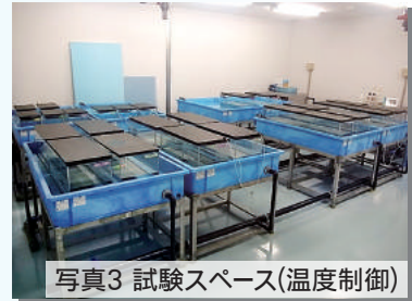
写真3 試験スペース(温度制御)