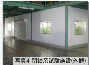
写真4 閉鎖系試験施設(外観)

施設内排水は、一旦当施設専用の排水タンク(6t)に集積された後に外部へ排出されますが、特に病原体等使用時の排水については、このタンク内で塩素滅菌、中和等の処理を施した後、当研究所内の化学排水処理系へ排出することで周辺環境への安全性を確保します。