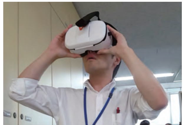
写真1「洪水VR」を体験している様子

このアプリには、写真1に示すようなVRゴーグルが必要です。VRゴーグル内には、「洪水VR」アプリをインストールされたスマートフォンを装着します。スマートフォンには、図1のような左眼用、右眼用の2画面が映し出されます。