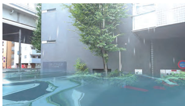
写真3「洪水AR」で街中が浸水した画面例