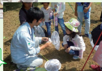
「子ども環境カレッジ」(大阪府)

いであグループでは、ご紹介した以外にもさまざまなCSR活動に取り組んでいます。活動は当社Webサイトで公開していますので、ぜひお立ち寄りください。