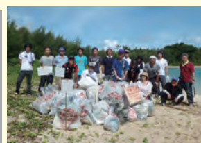
「いであクリーンビーチ」 (沖縄県)

また、いであグループは、社員の教育や研鑽が事業活動の継続に重要であるとの信念を持っており、事業活動を通じて得られた知識・知恵を社会に還元することが、社会的責任であると考えています。