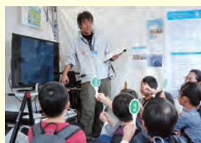
「東京湾大感謝祭」への出展 (神奈川県)

その他、イベントへの出展や地域清掃をとおり、いであグループの活動を紹介しながら地域との交流を深めています。