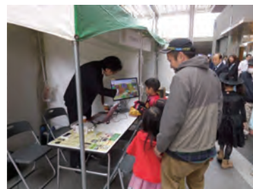
展示会での説明風景(左・中央:建設技術展2016近畿、右:エネフェスせたがや2016)