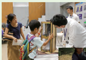
「子ども環境カレッジ」 (東京都)

NPO法人地球環境カレッジ ● http://www.gecollege.or.jp/