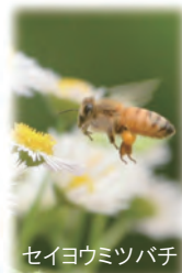
セイヨウミツバチ