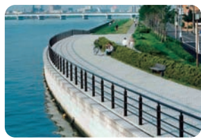
信濃川やすらぎ堤(新潟県新潟市)

この合併により『いであ株式会社』は、それぞれの会社で蓄積してきた技術、知識、経験のシナジーを機動的に発揮させて、安全・安心な社会の実現、建設と環境の調和、技術力の総合化・高度化・多様化を生かした成果の高品質化、地球温暖化への対応など、社会基盤の形成と環境保全の総合コンサルタントとして、さまざまな技術サービスを提供してまいります。