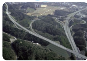
小郡ジャンクション(フオトモタージュ)(山口県山口市/山口宇部線)