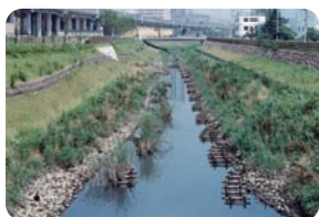
笹目川多自然型護岸(埼玉県川口市)