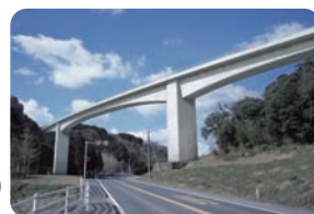
茜川橋(中九州横断道路)(大分県豊後大野市)