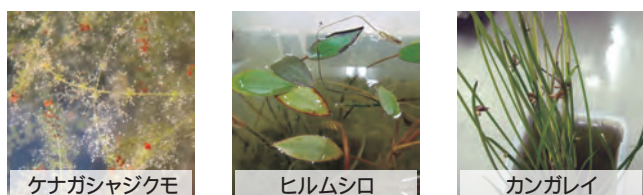
実験施設で埋土種子から発芽した代表的な種