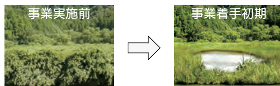
埋土種子を用いた自然再生の実験地 (笹の進入により乾陸化が進んだ土地を切り下げて、浅い池を含む湿地を造成し、埋土種子が含まれる土壌を撒き出す。)

既存の埋土種子調査は、現地において大規模に実施されるものが多く、長い調査期間を要するため、事業計画の策定段階の調査としては必ずしも適していませんでした。今回の取り組みでは、「室内の小規模な実験施設」で調査を実施し、「調査目的に応じた調査項目の絞込みを行う」ことで、低コストで効果的な調査を目指しました。