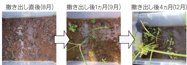
発芽実験の経過 (コメガヤツリが発芽)

調査の結果、調査地における埋土種子の特徴として、表1に示す点が明らかになりました。